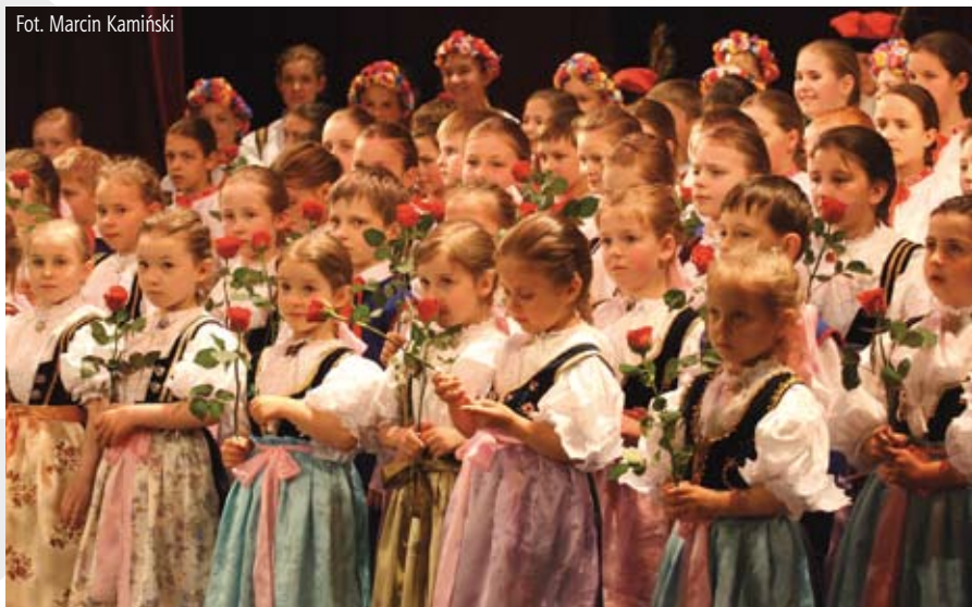
DZPiTZC na scenie teatru

W realizację przedsięwzięcia zaangażowanych było wiele osób, które w formie rzeczowej lub finansowej wspierały inicjatywę.