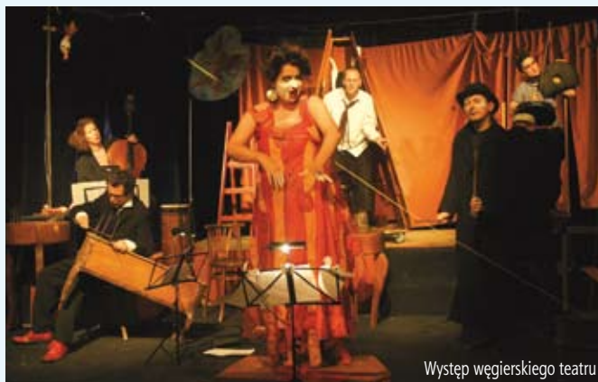
Występ węgierskiego teatru